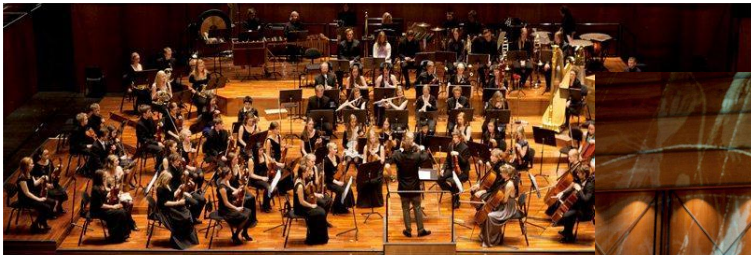
Elever fra kulturskolen i samspill med Trondheim symfoniorkester